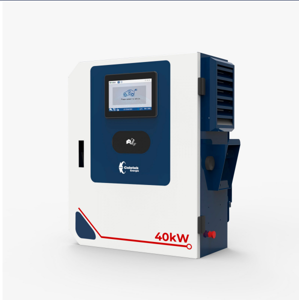
Imagem found or type unknown